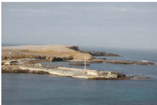
Oversiktsbilde som viser "kaianlegget" på Bjørnøya.

På seinsommeren i år skal Statsbygg renovere kaien i forbindelse med værvarslingsstasjon på Bjørnøya. Etter anbudsrunderen falt det naturlige valget på LNS som utførende entreprenør. I månedsskiftet juli - august sender vi dermed tre av våre beste arbeidere til Bjørnøya. Kontrakten er på litt under 3 millioner og arbeidet vil vare i rundt 2 måneder.