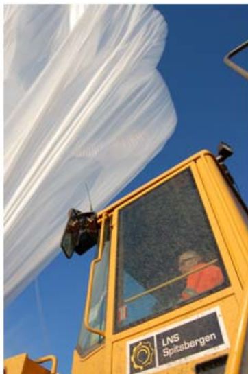
Ballongslipp i Longyearbyen