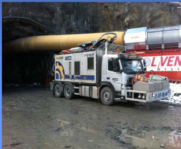
Juvelen fra Snemyr & Limm