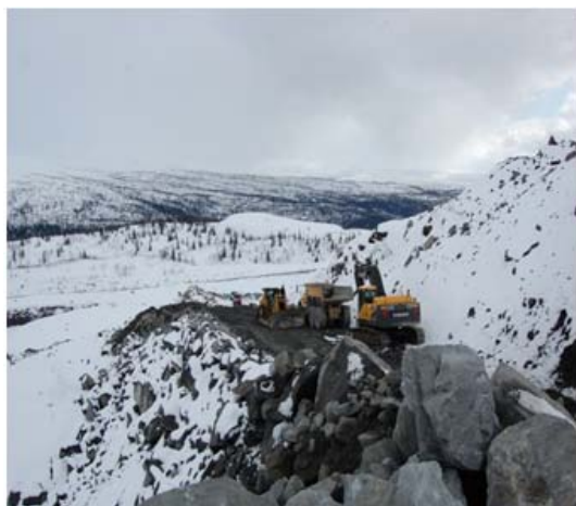
Vegbygging opp mot det nye Eriksbruddet.

I dagbruddene på Storforshei kjører vi malm fra Stortjønna. Slik det ser ut i dag avslutter vi den innen et par ukers tid og da er det kun en liten forekomst i Kristinemalmen og det nye Eriksbruddet vi blir å bryte ifra.