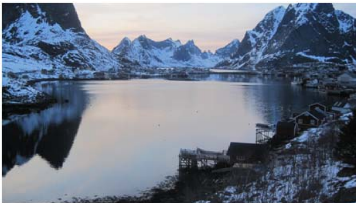
Hamnøy i Lofoten

I april var det Hamnøy, vårt tunnelprosjekt i Lofoten som fikk besøk. Også de fikk vist sin arbeidsplass fra sitt beste, med sol fra knallblå himmel. Begge prosjektene har en del ting og ta tak i og jeg fikk tilbakemelding om at revisjonen var svært nyttig. Nå i mai er det tunnelprosjektet i Volda sin tur.