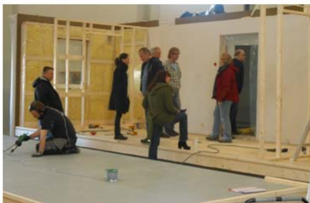
På besøk hos datterbedriften Hålogaland Element

Strategiarbeidet for LNS påvirker og har betydning i en eller annen form for hele LNS-konsernet. Arbeidet er tidkrevende og vi har en god involveringsprosess i forkant og planlegger også i etterkant. Dette er en kontinuerlig prosess.