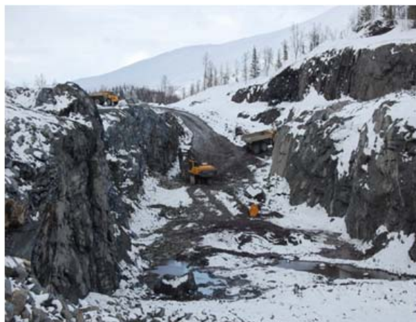
Utlasting av siste nivå på Stortjønna

Fra det nye Eriksbruddet kjører vi en del malm, men det er mestedels flytting av løs masser og gråberg for å klargjøre bruddet. Vi har en forhåpning om å ha malm tilgjengelig innen en 2-3 uker.