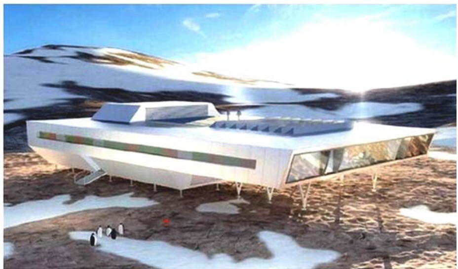
LNS Spitsbergen hadde første byggetrinn av den indiske forskningsstasjonen Bharrati, Antarktis

Når det gjelder oppdrag i det fjerne, sitter vi nå med anbudspapirene i forbindelse med antennebygging på Bharati i Larsemann Hills i Antarktis. Her er vi invitert til å gi pris på monteringen for det indiske selskapet som fikk jobben. Dette innebærer både montering i Antarktis nå til vinteren, samt prøvemontering av en av antennene nede i Hyderabad i India nå i sommer.