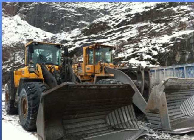
Bytting av maskiner

Ellers har vi fått en ny liftbil fra AMV og venter nå på en ny Atlas Copco XE3 tunnelrigg. Vi bytter vår L330 med en ny L350.