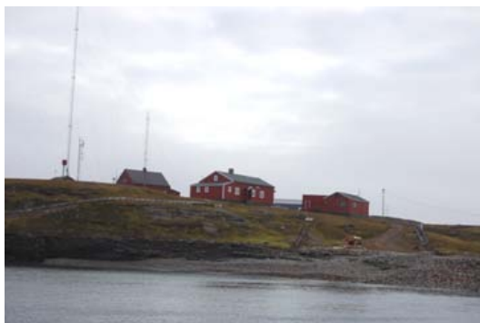
Viser bebyggelsen til værvarslingen.

Utbedring av kaien består i å sprengte bort ett par skjær i forbindelse med kaien, diverse betongreparasjoner av selve kaien og etablering av en 26 meter lang bølgebryter i betong. I tillegg til dette har vi fått bestilling på ett 80 m 2 stort garasjeggulv med ringmur som utføres når vi likevel har kompetanse og utstyr på plassen. For å frakte utstyr, materiell og personell blir vi å bruke Kystvakta og/eller fraktbåtene fra Zahl transport eller Bring. Siste bit inn til kai fra disse store båtene besørgeres av mannskap fra værvarslinga med en liten lekter på ca 3 x 6 meter. Arbeidet med å få alt på plass inklusive koordinering av logistikken gjøres i samarbeid med Statsbygg og værvarslingen.